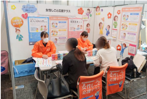
女性しごと応援テラス (東京しごとセンター)