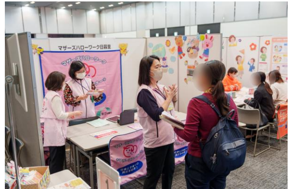
マザーズハローワーク日暮里