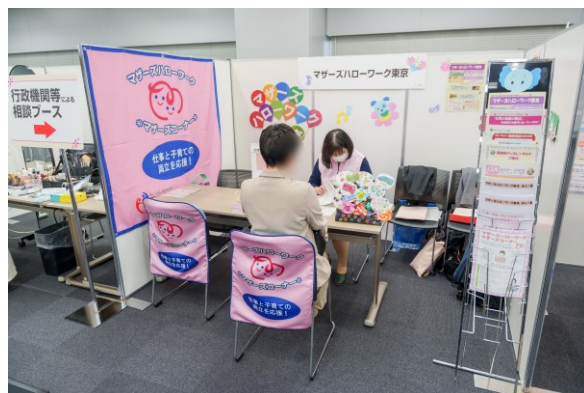
マザーズハローワーク東京