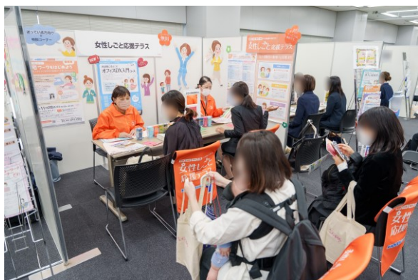
女性しごと応援テラス (東京しごとセンター)