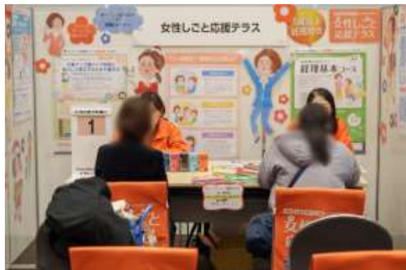
女性しごと応援テラス (東京しごとセンター)