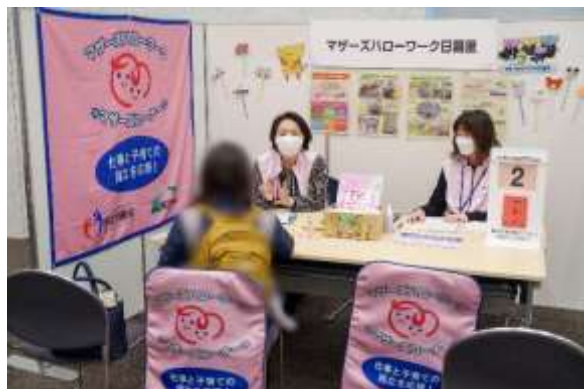
マザーズハローワーク日暮里