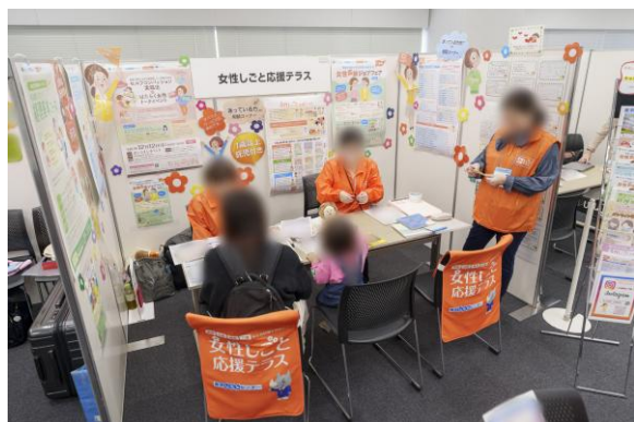
女性しごと応援テラス（東京しごとセンター）