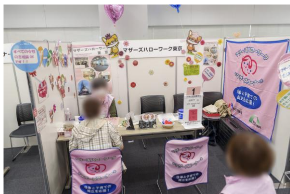
マザーズハローワーク東京